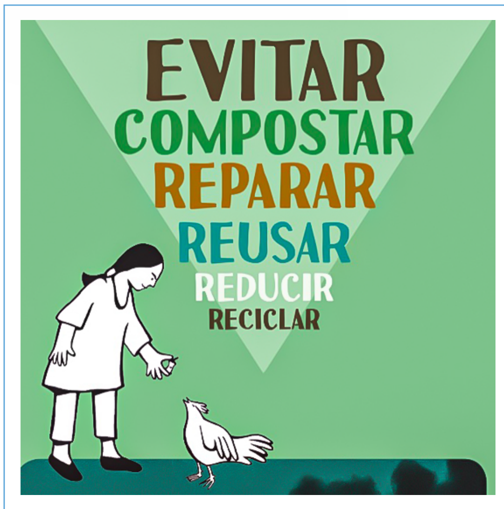
Imagen n°1: Jerarquía de acciones Basura Cero

Basura Cero es una estrategia para el manejo tanto de los residuos como de nuestros bienes naturales comunes. La idea de Basura Cero nos propone buscar formas de transformar la economía y el sistema productivo para que vuelvan a funcionar con las leyes de la naturaleza, recuperando los materiales residuales que pueden volver a ser usados, reparados o reciclados, devolviendo los nutrientes al suelo, y rediseñando lo que actualmente no puede ser recuperado para que en el futuro podamos tener sociedades que no generen basura. En la imagen n°1, vemos la pirámide invertida que jerarquiza las acciones basura cero.